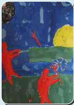
Kelemen Bence (III. kcs., 2. hely)