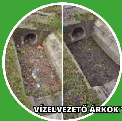
VÍZELVEZETŐ ÁRKOK TAKARÍTÁSA, MÉLYÍTÉSE