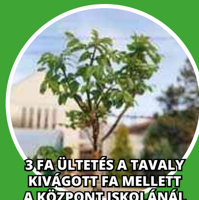
3 FA ÜLTETÉS A TAVALY KIVÁGOTT FA MELLETT A KÖZPONTISKOLÁNÁL