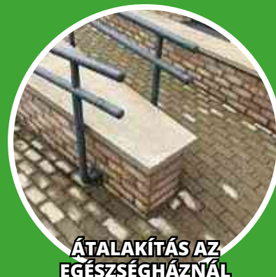
ÁTALAKÍTÁS AZ EGÉSZSÉGHÁZNÁL