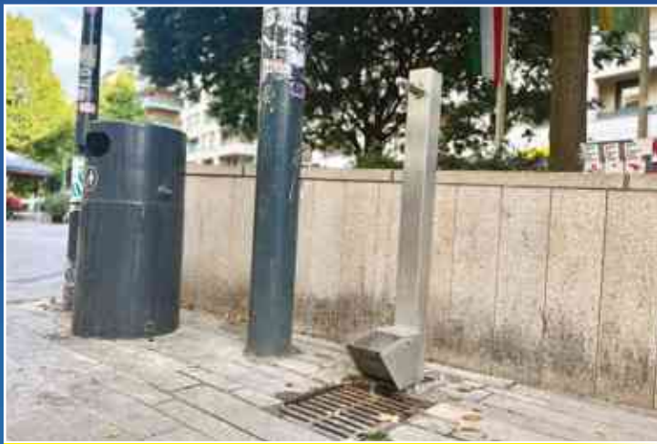
Ivókutak létesítése Józsefvárosban