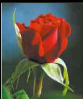
Köszöntjük a hölgyeket! ▶ 8-9.