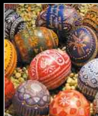
Áldott húsvétot kívánunk!