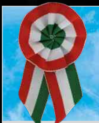
Ünnepi programok ▶ 9.