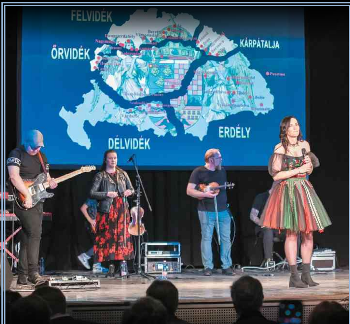
XVII. Kárpát-medencei Magyar Találkozó ▶ 2-5.

AZ ÖNKORMÁNYZAT INGYENES TERJESZTÉSŰ HAVILAPJA