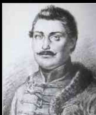
Bánk bán-ünnep ▶ 8.